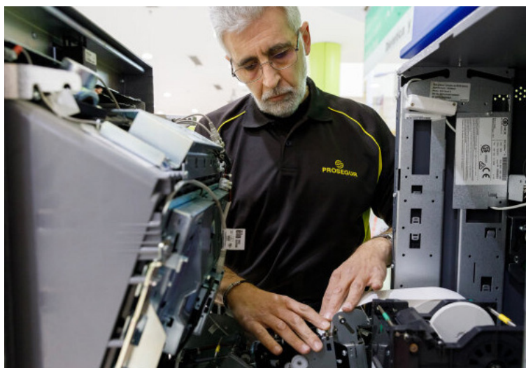
Un técnico lleva a cabo trabajos de mantenimiento en un cajero automático.

Mientras el usuario realiza una transacción en cuestión de segundos, detrás existe una infraestructura que trabaja permanentemente para garantizar que el efectivo llegue de manera segura, eficiente y sin interrupciones a miles de personas en todo el país.