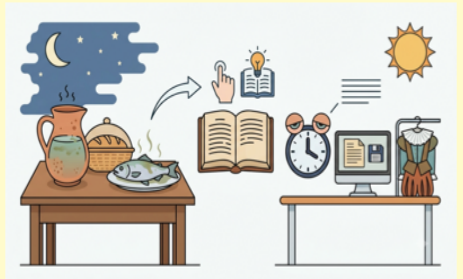
Imagen creada por Gemini / Google AI

El significado que se refiere a las personas es el que se emplea más por estas regiones. No obstante, el cambio semántico de este adjetivo tiene fundamento, pues, así como una persona que no ha dormido bien presenta al día siguiente muestras de cansancio, de la misma manera algunos alimentos o cosas que se dejan expuestos durante la noche pueden descomponerse o degradarse.