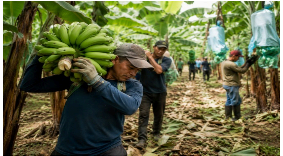
Trabajadores de sectores estratégicos como el agrícola y bananero enfrentan nuevos desafíos relacionados con prevención, bienestar y salud ocupacional en Ecuador.

Además, las nuevas generaciones comienzan a priorizar cada vez más aspectos relacionados con bienestar, salud y equilibrio personal dentro de sus decisiones laborales. Frente a este escenario, organizaciones vin-