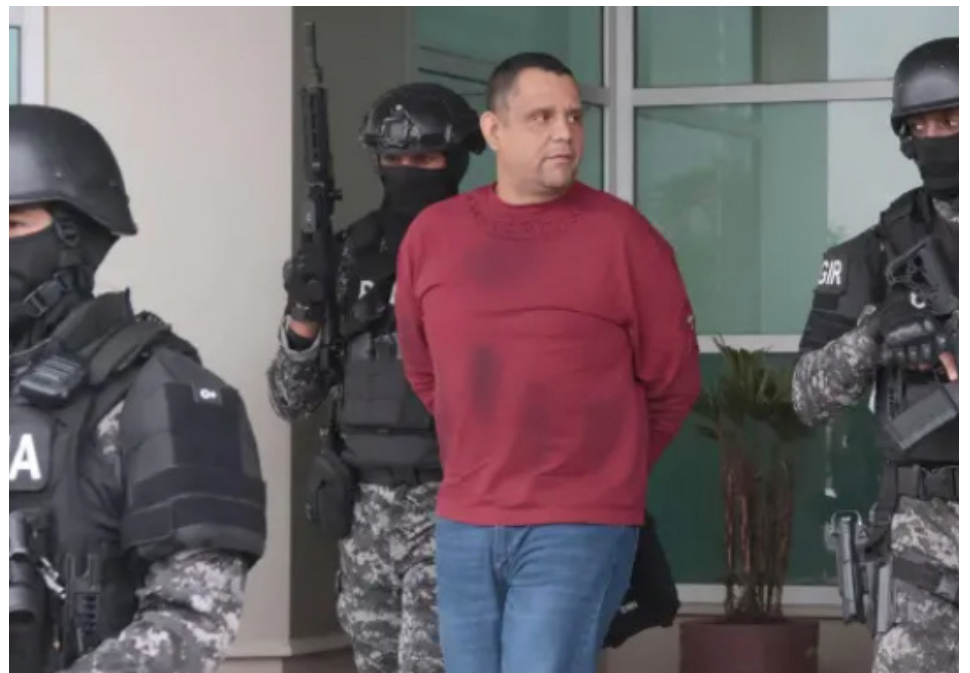
Alcalde de Esmeraldas, Vicko Villacís, es aprehendido tras allanamiento por presuntas actividades delictivas.

Ocho detenidos y 18 allanamientos La Operación Blindaje movilizó a 200 servidores policiales y 14 fiscales, quienes ejecutaron 18 allanamientos en cuatro provin-