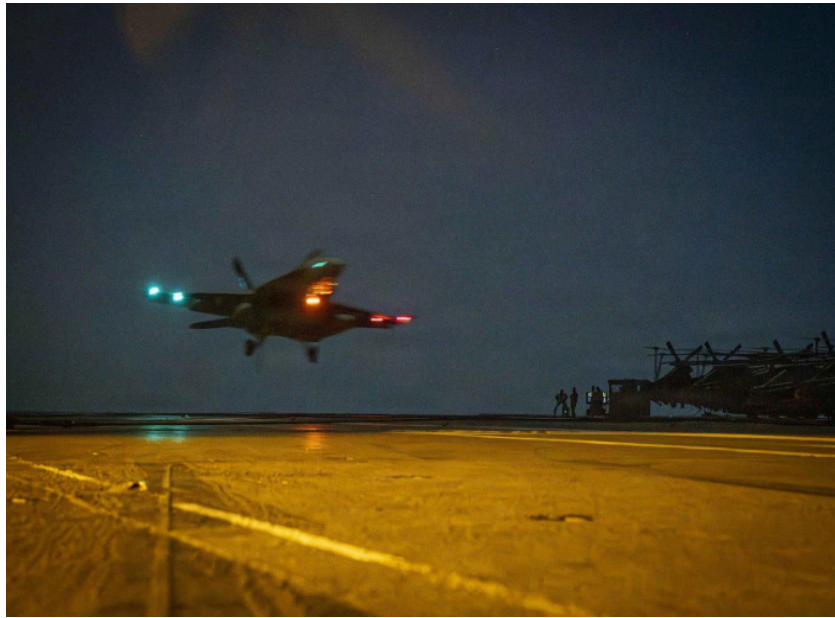
diversos enclaves de la República Islámica.

Ataques iraníes como represalia Horas antes, durante la madrugada de este mismo miércoles, la Guardia Revolucionaria de Irán reivindicó el lanzamiento de una oleada de drones contra bases de Estados Unidos en Bahrein, Jordania y Kuwait. Según la versión iraní, esta acción se realizó como represalia por las agresiones perpetradas previamente por Washington contra