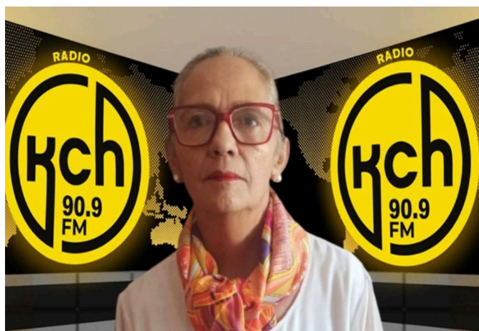
Berenice Cordero, exministra de Inclusión Social.

Manifestó la exministra de Inclusión Social Berenice Cordero que la alta polarización política ha hecho que no se puedan trabajar fuertemente en los sectores sociales, porque así como queremos seguridad también se requiere de salud, educación y en cuanto a vivienda existe un proyecto interesante de parte del gobierno, pero los resultados o los informes de la FAO nos habla que Ecuador