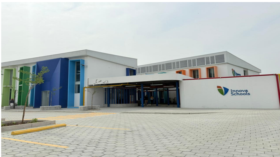
Sede de Innova Schools en La Aurora, Daule.

Quienes estén interesados en participar en el proceso de admisiones de Innova Schools La Aurora pueden hacerlo llenando el formulario de información en www.innovaschools.edu.ec y esperar la llamada de un asesor, quien estará a las órdenes para resolver dudas de los aspirantes, programar una visita a la sede, y posteriormente, de la mano del equipo de educación, agendar la valoración integral del estudiante para poder asegurar su cupo.