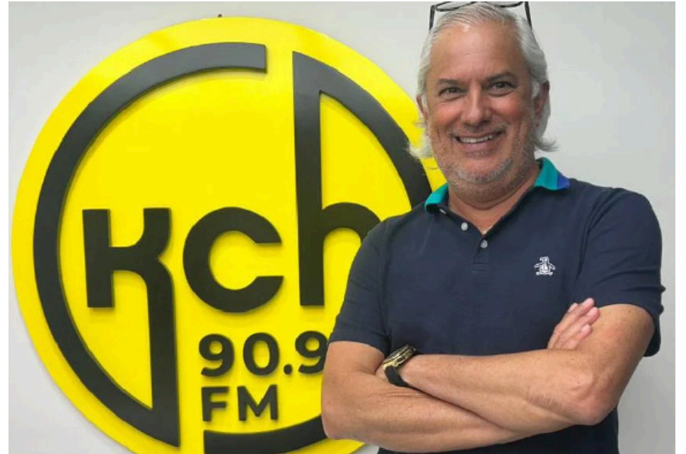
Detalles del Evento