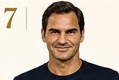
7 | Roger Federer

Ícono global del fútbol, marcas y negocios.