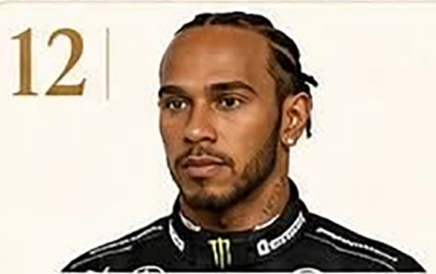
12 | Lewis Hamilton

Uno de los nombres más grandes en la historia del automovilismo.