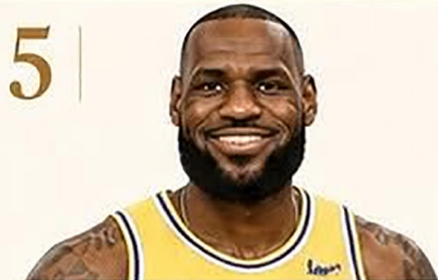
5 | LeBron James

Uno de los atletas más rentables de todos los tiempos.