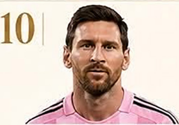
10 | Lionel Messi

Amazona de élite ligada a una poderosa fortuna familiar.