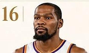
16 | Kevin Durant

Boxeador célebre por convertir cada pelea en un negocio masivo.