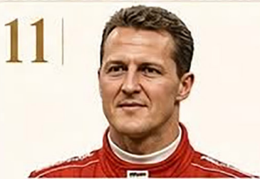
11 | Michael Schumacher

Talento histórico con enorme impacto comercial global.