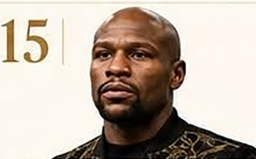
15 | Floyd Mayweather Jr.

Estrella del fútbol con enorme valor comercial.