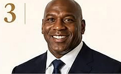
3 | Magic Johnson

Extenista convertido en poderoso empresario europeo.