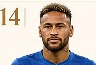
14 | Neymar Jr.

Éxito deportivo transformado en un imperio empresarial.