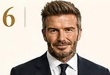
6 | David Beckham

Figura dominante dentro y fuera de la cancha.