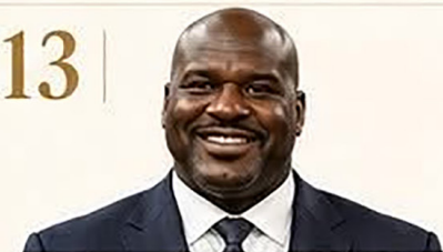
13 | Shaquille O'Neal

Campeón mundial con gran influencia deportiva y mediática.