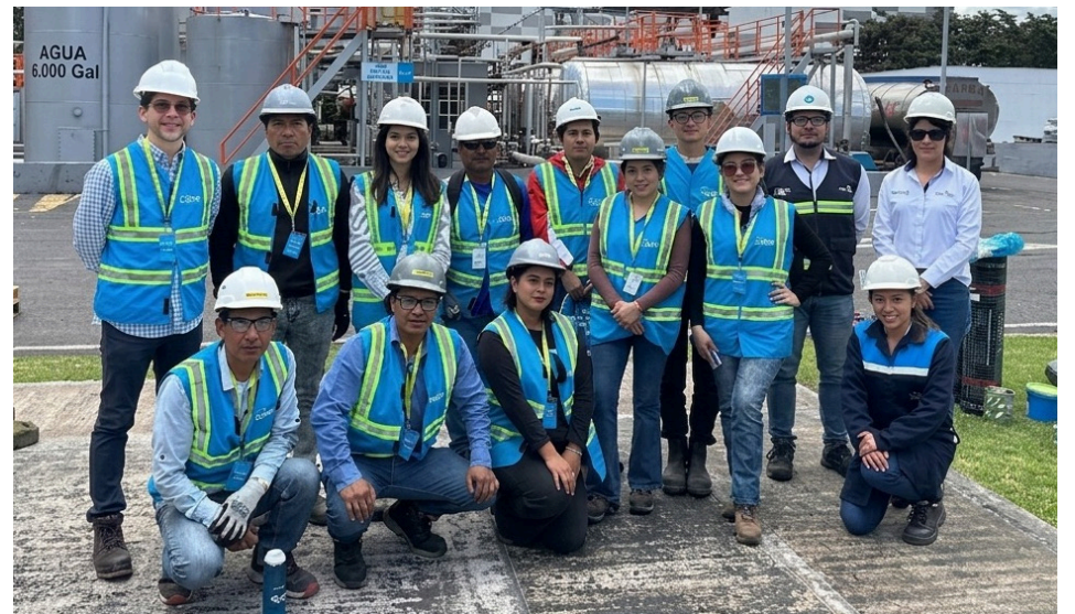
Equipo Corporativo de Imptek Saint-Gobain y equipo de la Academia de la Construcción

A esto se suma la Academia Imptek, una plataforma en línea que amplía el acceso a la capacitación en impermeabilización y vialidad, fortaleciendo la formación continua y el uso