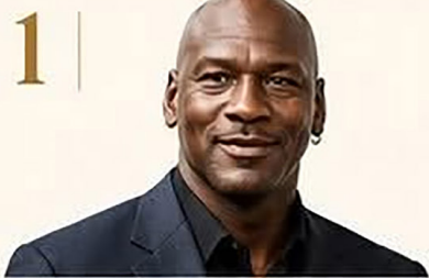
1 | Michael Jordan