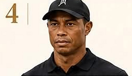
4 | Tiger Woods

Multiplicó su legado deportivo con inversiones estratégicas.