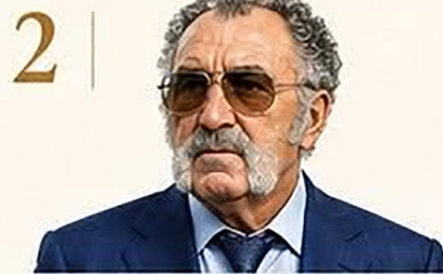
2 | Ion Țiriac

Leyenda de la NBA y gigante del negocio global.