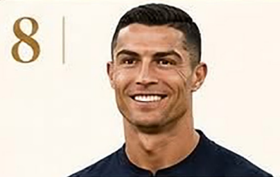
8 | Cristiano Ronaldo

Elegancia deportiva convertida en marca multimillonaria.