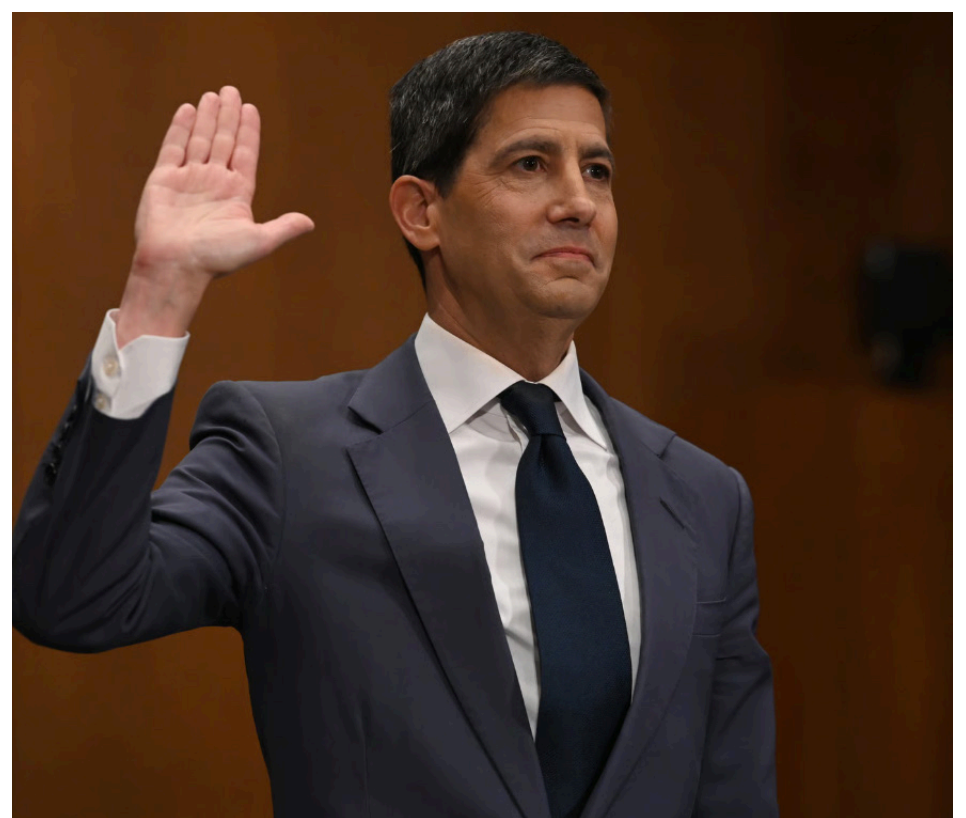
Warsh nació en el norte del estado de Nueva York. Se licenció en la Universidad de Stanford y obtuvo su doctorado en Derecho en la Facultad de Derecho de Harvard.

Anteriormente, Warsh había sido miembro del Departamento de Fusiones y Adquisiciones de Morgan Stanley & Co. en Nueva York, donde ocupó los cargos de vicepresidente y director ejecutivo.