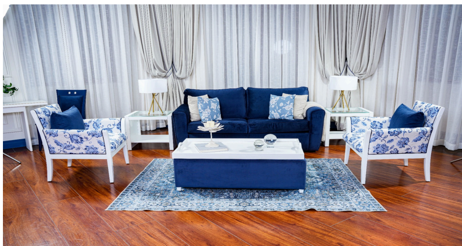
Habitación del Hotel del Parque, Guayaquil.

Con estas intervenciones en Guayaquil y Cuenca, Colineal continúa consolidando su experiencia en el desarrollo de mobiliario especializado para hotelería, fortaleciendo su relación con importantes actores del sector y ampliando su participación en proyectos a nivel nacional.