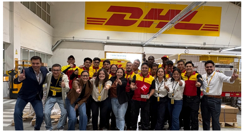
Colaboradores de DHL Express Ecuador durante su jornada laboral, reflejando una cultura basada en colaboración, compromiso y alto estándar operativo.