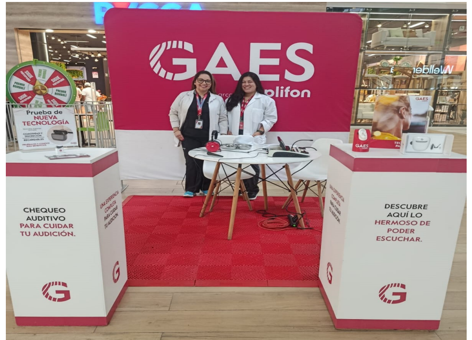
Jornadas auditivas GAES

Con esta nueva jornada auditiva, GAES reafirma su compromiso permanente con la capital de los ecuatorianos, acercando servicios especializados y acciones de prevención que contribuyen al bienestar de la ciudadanía. La compañía mantiene su propósito de seguir impulsando iniciativas que permitan a más personas cuidar de sus oídos y acceder a información confiable.