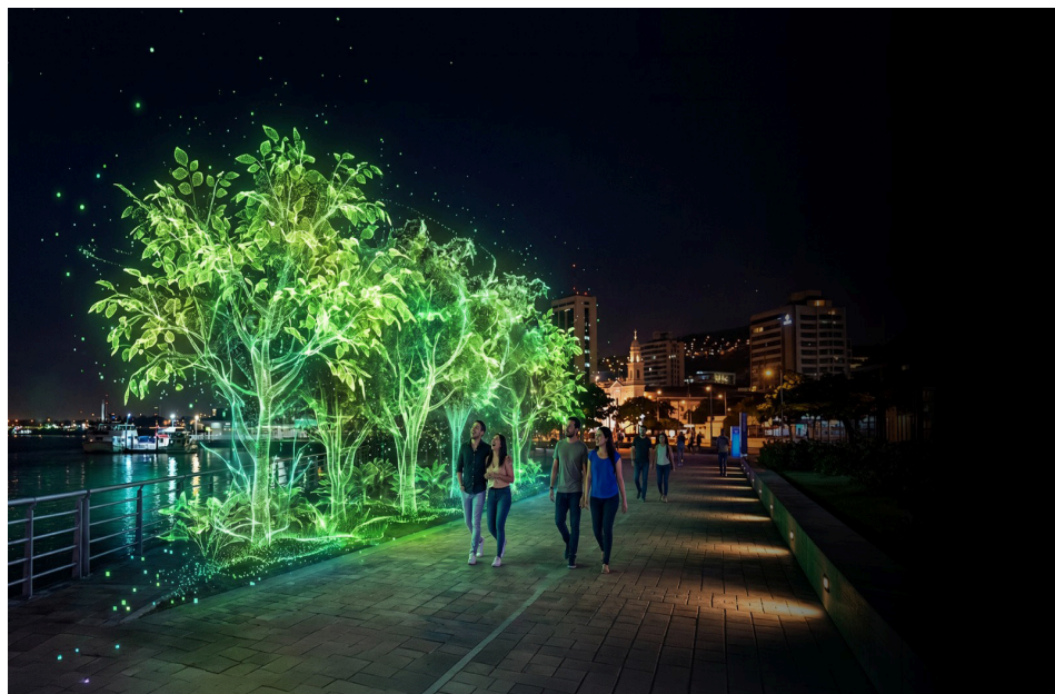
La energía solar generada por SolarTeam equivale al impacto ambiental de plantar 25.000 árboles en Ecuador.

Con este avance, la compañía proyecta un crecimiento continuo en los próximos años, con el objetivo de ampliar su alcance y consolidar un modelo energético más resiliente para el Ecuador.