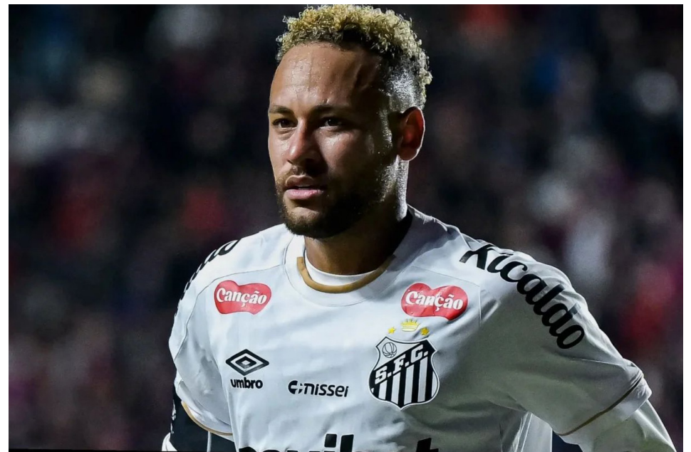
El 13 de noviembre de 2015, en tanto, se enfrentó a la Selección argentina con Selección de Brasil por las Eliminatorias rumbo al Mundial 2018, en un partido que terminó 1-1.

La última vez que había enfrentado a un equipo argentino había sido en 2012, cuando con Santos se midió ante Vélez por la ida de los cuartos de final de la Copa Libertadores.