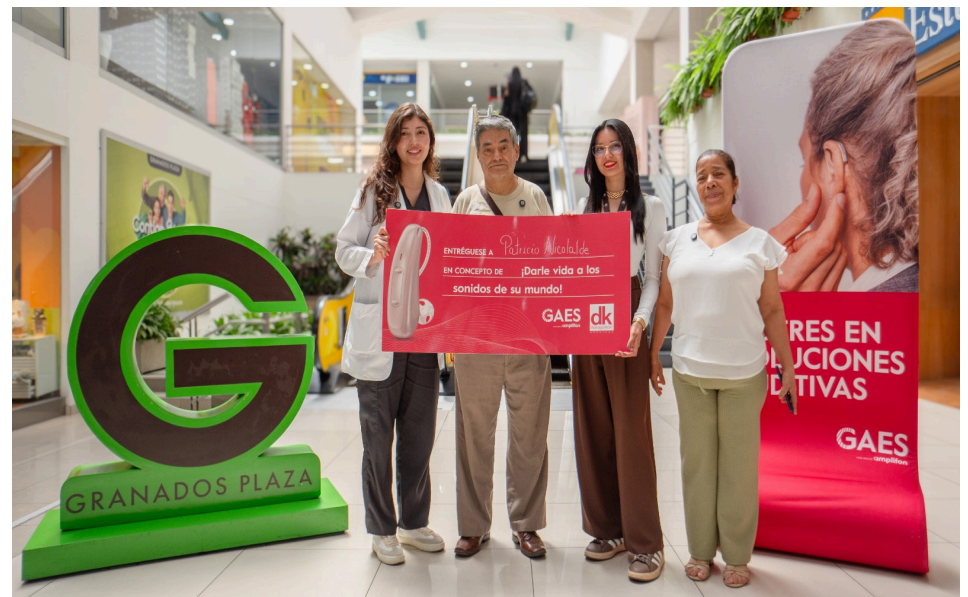
Donaciones en Granados Plaza.

En el marco de esta colaboración y las jornadas realizadas durante 2025, GAES dispuso de equipos especializados como audiómetros y video otoscopio, así como material educativo y protocolos de segui-