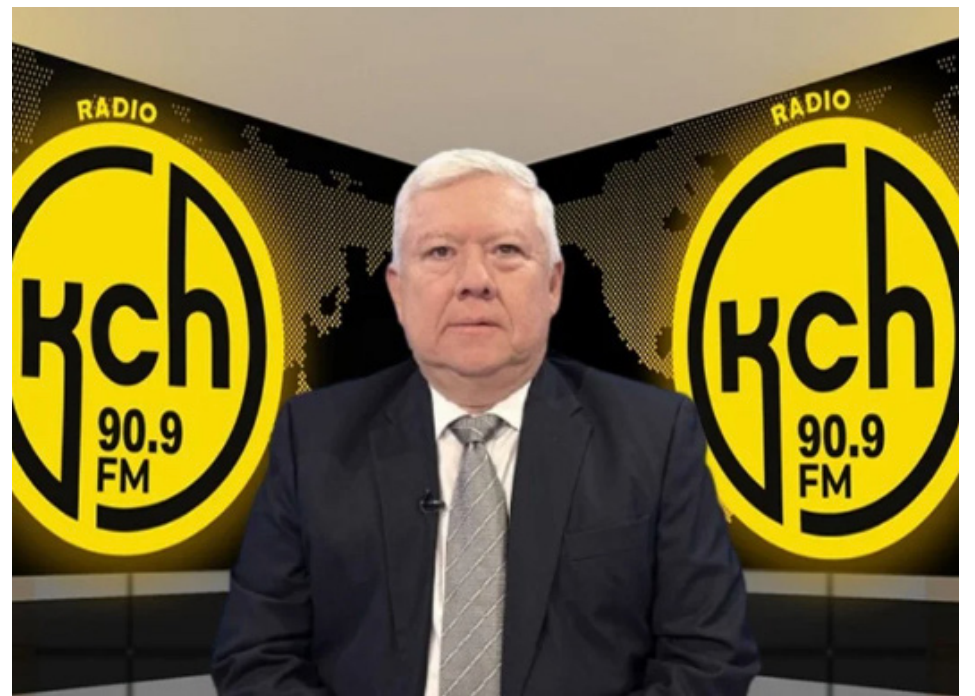
Fausto Ortiz exministro de Finanzas.

El riesgo país es un indicador que se origina a partir de la renegociación de nuestros bonos de deuda externa que son tres el llamado 20-30, 20-35 y 20-40 que entre los tres suman unos 15.000 millones de dólares en bonos que se negocian en este momento a un rendimiento del 9% que se traducen en 900 puntos, ahora le quitamos los 400 puntos o el 4% que se negocia el tesoro americano entonces llegamos a los 400 puntos en todo caso es un buen momento del riesgo país al menos en ocho años, todavía no se llega al récord histórico cuando el riesgo