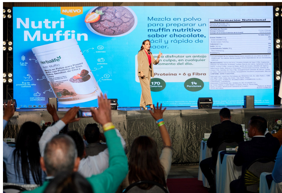
Distribuidores Independientes recibiendo taller en el evento “Fin de Semana de Liderazgo” en Cuenca - Ecuador.

De esta forma, Herbalife consolida a estas jornadas como espacios clave para fortalecer el conocimiento y las habilidades de sus Distribuidores Independientes. Además, se recordó que quienes apuestan por este modelo de emprendimiento pueden fijarse sus propios objetivos y decidir el tiempo que le dedican y la forma en que desarrollan su negocio independiente de venta directa y multinivel.