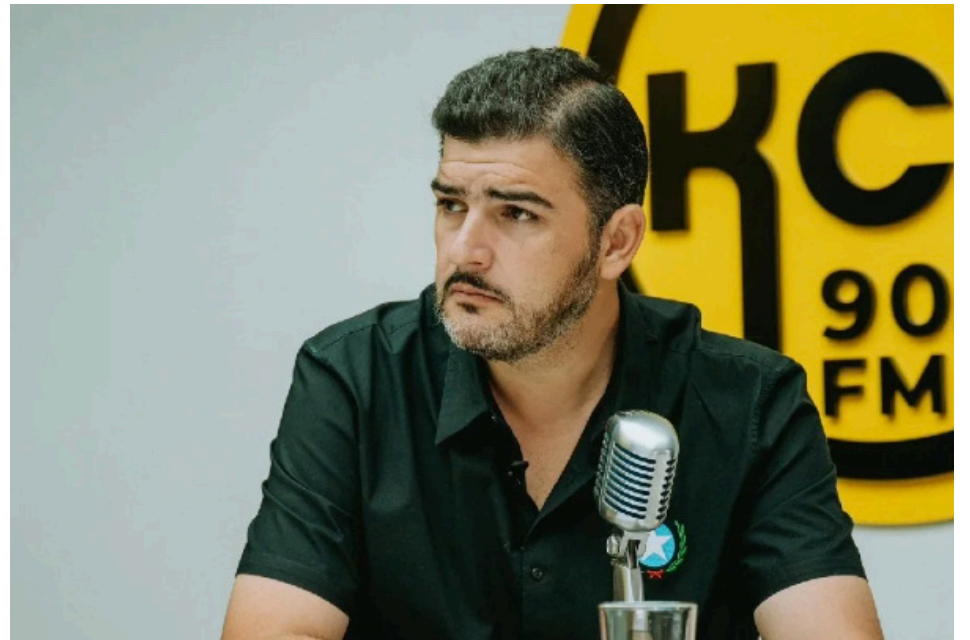
El alcalde de Guayaquil Aquiles Alvarez.

Después de haber terminado los estudios del transporte fluvial se tendrá que crear la empresa municipal para este sistema de transporte fluvial aunque de primera suena como una quimera pero queremos darle un sistema de transporte fluvial para Guayaquil y para aquello estamos trabajando también con la Prefectura del Guayas es decir mancomunadamente. La inauguración de obras continúan este día se inaugurará una Estación de Acción Segura (EAS) en las inmediaciones de la Urbanización Terranostra vía a la Costa y se piensa llegar a diciembre de este año con 26 EAS, de la