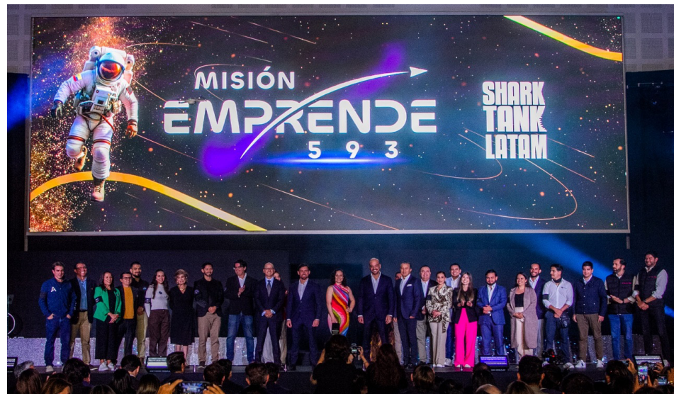
En la fotografía: Emprendedores y Jurados que serán parte del programa “Misión Emprende 593 con Shark Tank Latam”