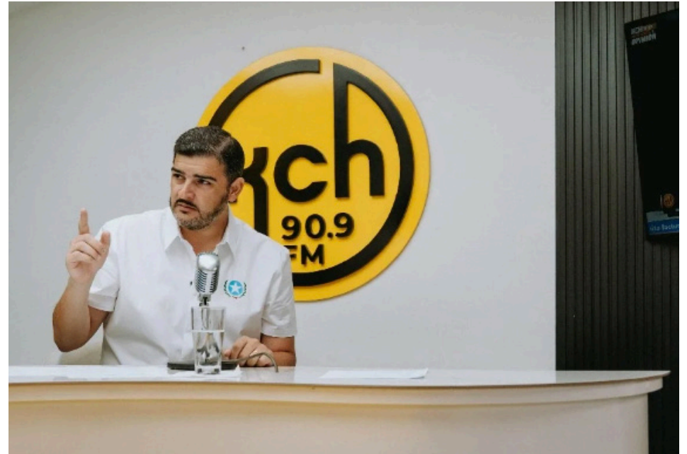
Aquiles Alvarez, alcalde de Guayaquil.

Según el alcalde, el objetivo es impedirle una futura postulación política, ya sea para